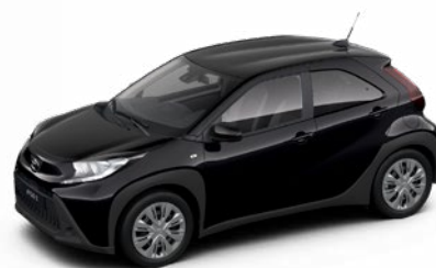
209 Éjfékete* 130 000 Ft Elérhető az Active és Comfort felszereltségnél