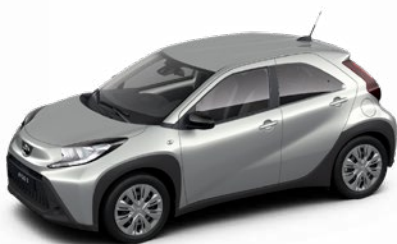
1L0 Prémium ezüst* 130 000 Ft Elérhető az Active és Comfort felszereltségnél