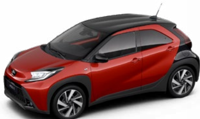
2VH Chilivörös fekete tetővel Felár nélkül Prémium fényezés Elérhető a Style és Executive felszereltségnél