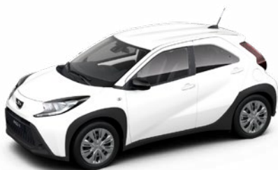
040 Hófehér felár nélkül Elérhető az Active és Comfort felszereltségnél