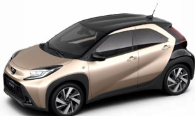
2VJ Gyömbér bézs fekete tetővel Felár nélkül Prémium fényezés Elérhető a Style és Executive felszereltségnél