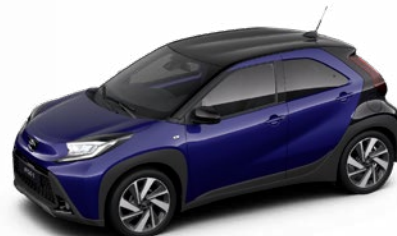
2VL Boróka kék fekete tetővel Felár nélkül Prémium fényezés Elérhető a Style és Executive felszereltségnél