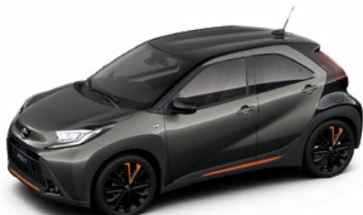
2VK Kardamom zöld fekete tetővel Felár nélkül Prémium fényezés Elérhető a Style és Executive felszereltségnél