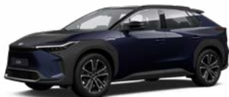
2MT Mélytenger-kék, fekete tetővel* felár nélkül Executive felszereltséghez rendelhető