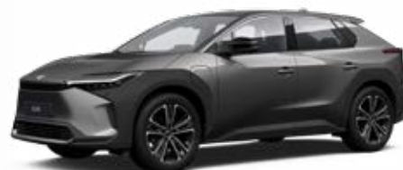
1L5 Nikkelezüst** 120 000 Ft