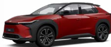
2TB Érzéki vörös, fekete tetővel** 120 000 Ft Executive felszereltséghez rendelhető