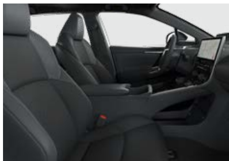
Bőr ülésborítás szövet betétekkel (szintetikus bőr) Alapfelszereltség: Prestige