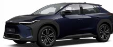
8S6 Mélytenger-kék* felár nélkül