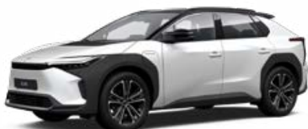
2VP Platina gyöngyfehér, fekete tetővel** 120 000 Ft Executive felszereltséghez rendelhető