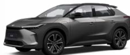
2VC Nikkelezüst, fekete tetővel** 120 000 Ft Executive felszereltséghez rendelhető