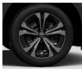
18" könnyűfém keréktárcsák, dísz tárcsával Alapfelszereltség: Comfort és Prestige