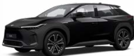
202 Asztrálfekete* felár nélkül