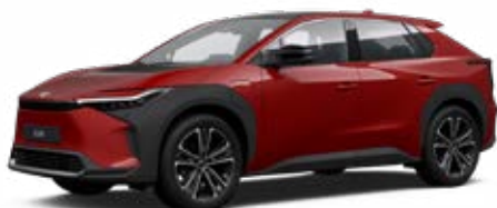
3U5 Érzéki vörös** 120 000 Ft