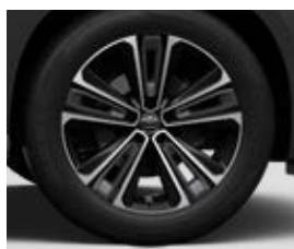
20" könnyűfém keréktárcsák, porvédő kupakkal Alapfelszereltség: Executive és Premiere Edition