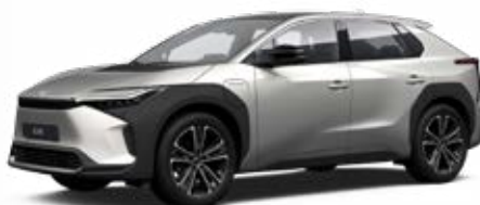
1J6 Krómezüst** 120 000 Ft