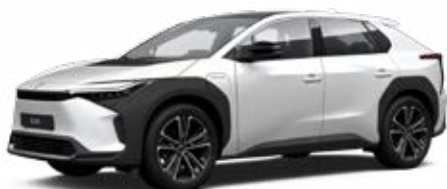
089 Platina gyöngyfehér** 120 000 Ft