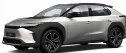
2MR Krómezüst, fekete tetővel** 120 000 Ft Executive felszereltséghez rendelhető