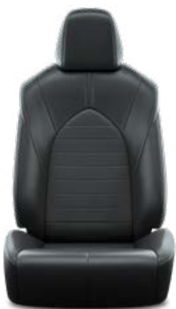
Bőrhátús szövet Alapfelszereltség a Comfort modellváltozaton