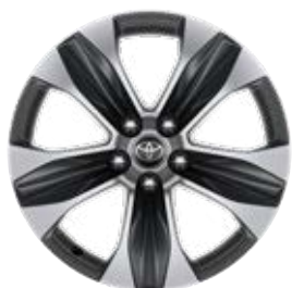
18" sötétszürke, csiszolt felületű könnyűfém felni (5 küllős) 235/65 R18 gumibronccsal Alapfelszereltség a Comfort modellváltozaton