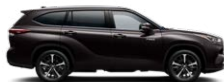
4X9 Sötétbarna metálfényezés