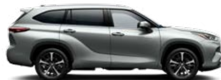
1J9 Ezüstmetál metálfényezés