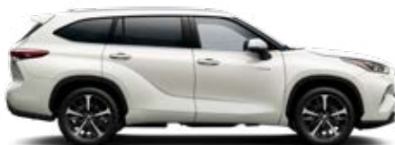
070 Gyöngyfehér prémium gyöngyház fényezés