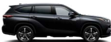
218 Fekete gyöngyház metálfényezés

A Highlander ügyfélárak tartalmazzák a metálfény felárat, a prémium fényezés felárat a Premium felszereltségek tartalmazza.