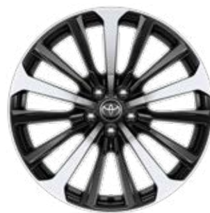
20" kéttónusú könnyűfém felni 235/55 R20 gumiabronccsal Alapfelszereltség az Executive modellváltozaton