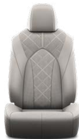
Grafitszürke perforált bőr, gyémántmintázatú, fekete varrással Alapfelszereltség az Executive modellváltozaton