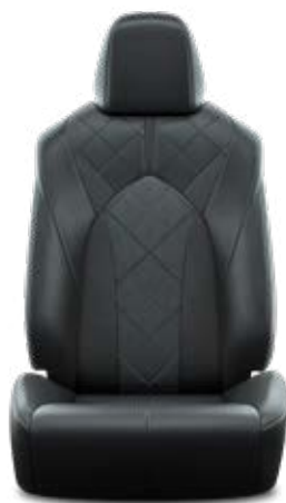
Fekete perforált bőr, gyémántmintázatú, fekete varrással Alapfelszereltség az Executive modellváltozaton