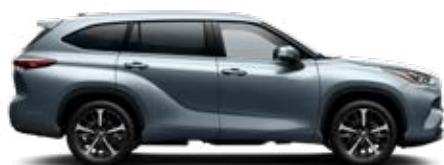
1K5 Holdfény prémium metálfényezés