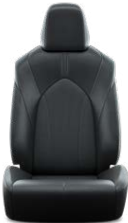
Fekete perforált bőr, steppelt, fekete varrással Alapfelszereltség a Prestige modellváltozaton