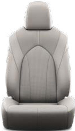
Grafitszürke perforált bőr, steppelt, fekete varrással Alapfelszereltség a Prestige modellváltozaton