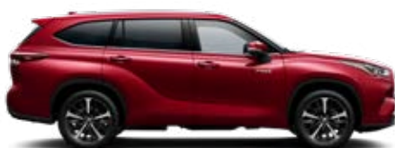
3T3 Vörös prémium metálfényezés