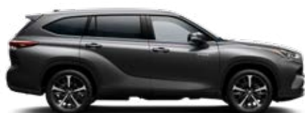
1G3 Hamuszürke metálfényezés