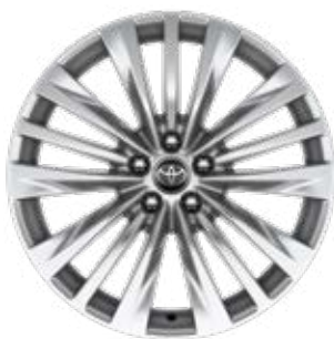
20" ezüstsínű könnyűfém felni 235/55 R20 gumiabronccsal Alapfelszereltség a Prestige modellváltozaton