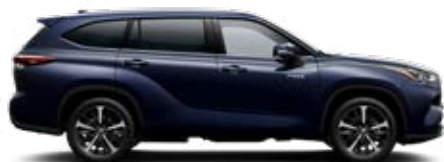
8X8 Sötétkék mica metálfényezés